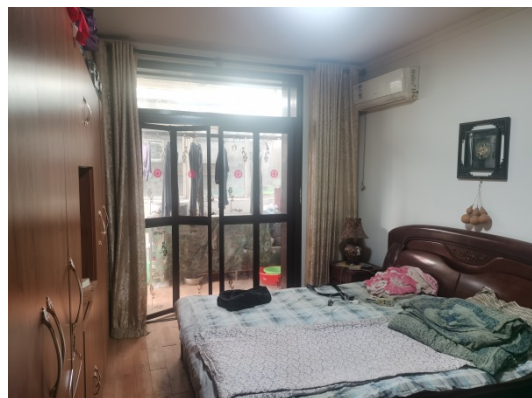
估价对象内外部状况及周围环境和景观照片